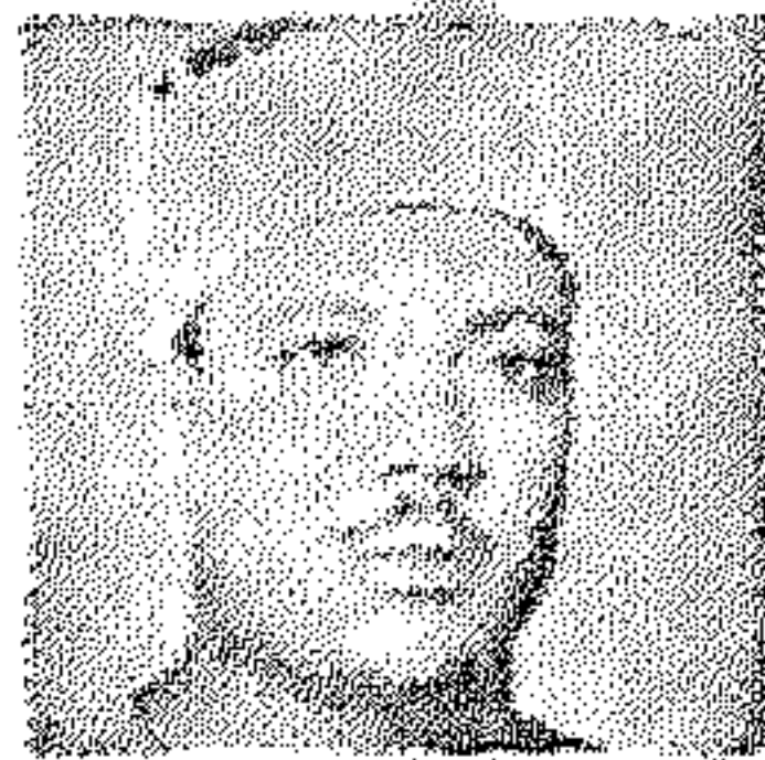
الشيخ عبد الباسط عبد الصمد